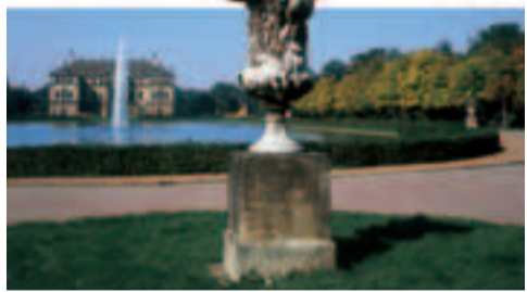
Дворец в парке «Гроссер Гартен»

На площади в два квадратных километра раскинулся парк «Гроссер Гартен», соединяющий сквер Бюргервице с центральной частью города. Расположенный посередине этого парка дворец – первое здание Дрездена в стиле барокко. К территории парка относятся зоопарк, ботанический сад, летняя сцена и пруд с гондолами. До всех