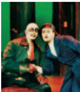
Государственный драматический театр

Дополнительную информацию Вы найдете в еженесячной программе мероприятий или же в сети «Интернет» по адресу: http://www.dresden-tourist.de