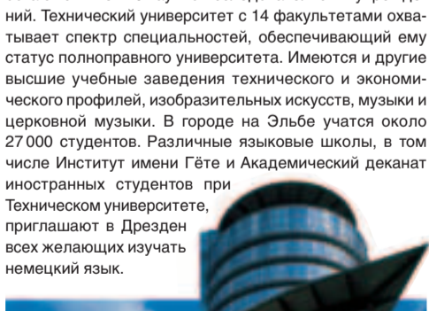
Дрезденский центр международной торговли

гальтеров, камеры с зеркальным отражателем, ступенного молока промышленного изготовления, тубока с зубной пастой, средства полоскания для рта и другое. Сегодня Дрезден является ведущим в Европе центром прогрессивной технологии. Здесь обосновались фирмы «Сименс», «АМД» и «Моторола». В городе на Эльбе работают свыше 120 научно-исследовательских учреждений. Технический университет с 14 факультетами охватывает спектр специальностей, обеспечивающий ему статус полноправного университета. Имеются и другие высшие учебные заведения технического и экономического профиля, изобразительных искусств, музыки и церковной музыки. В городе на Эльбе учатся около 27000 студентов. Различные языковые школы, в том числе Институт имени Гёте и Академический деканат иностранных студентов при Техническом университете, приглашают в Дрезден всех желающих изучать немецкий язык.