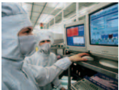
Дрезденский центр микроэлектроники Фирмы «Сименс»

У Дрездена давние традиции не только в области искусства и культуры, но и в плане новаторской мысли и творческого подхода. Уже в эпоху барокко Дрезден был колыбелью многочисленных изобретений, например, первого европейского фарфора, первой железной дороги Германии для поездов дальнего следования, первого немецкого пилзенского пива, фильтра для кофе, биост-