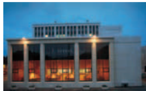
Радебергская экспортная пивоварня

воварен Германии – Радебергскую экспортную пивоварню . В этой пивоварне было изготовлено первое в Германии пиво по пилзенскому рецепту. В Радеберге Вы увидите, как варится и разливается один из перво-классных сортов пива Германии – Радебергское пилзенское пиво, которое сегодня выпускается на базе новейшего оборудования. После экскурсии по пивоварне Вы можете насладиться свежим, прямо из бочки, Радебергским пилзенским пивом в уютной, гостеприимной обстановке исторического «Каизерхоф», трактира Радебергской экспортной пивоварни. Коллектив Радебергской пивоварни будет рад приветствовать Вас у себя. На экскурсии (на немецком языке) для 15 и более человек, просьба оформлять заказы за 5 дней до экскурсии: телефон (+49 35 28) 45 48 80, факс (+49 35 28) 45 48 88.