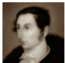
Карл Мария фон Вебер

С оперой тесно переплетается и католическая церковная музыка, которой по праздникам посвящены выступления ансамбля мальчиков Дрезденской капеллы и соборного хора в бывшей Придворной церкви Хофкирхе. В субботу во время вечерни звучит орган работы Зильбермана (с мая по октябрь). Мировой славы пользуется также Дрезденская филармония, которая почти каждые выходные приглашает любителей музыки на концерты, устраиваемые во Дворце культуры.