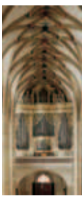
Собор в г. Фрейберг

также замок Штольпен , в котором на протяжении почти 50 лет содержалась в заключении графиня Козель, одна из фавориток Августа Сильного. С «Рождественским краем» – Рудными горами – лучше всего знакомиться в г. Зейффен , центре традиционного искусства резьбы по дереву. Материалы музея Фраунштейна рассказывают о жизни органичного мастера Готфрида Зильбермана, творения которого сохранились в некоторых из деревенских церквей в округе. Один из его самых крупных и значительных инструментов находится в соборе города Фрейберга . Баутцен , центр Верхней Лужицы, с его средневековыми городскими укреплениями и Музеем лужицкой культуры тоже является интересной целью путешествия. В рамках однодневной экскурсии из Дрездена можно съездить в Лейпциг, Берлин и Прагу. В городе пивоваров Радеберге, расположенном в 15 км от Дрездена, Вы найдете одну из новейших пи-