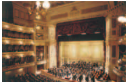
Опера им Г. Земпера

Немеркнущая слава Дрездена неразрывно связана с его замечательными музыкальными традициями. Дрезденскому хору мальчиков Кройцхор, например, уже более 700 лет. По субботам хор мальчиков поет в церкви Кройцкирхе во время вечерни (летом в 18 часов, а зимой в 17 часов).